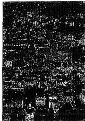
Monterotondo Già sono molte le iniziative intraprese per salvaguardare l'ambiente

trovano una cornice condivisa che integra diverse iniziative. Voglio ringraziare tutti coloro che in questi anni ci hanno dato una mano e sostenuto, stiamo percorrendo la strada giusta". Tutto questo potrà essere realizzato grazie al contributo di tante realtà territoriali che stanno contribuendo in maniera attiva ai vari progetti. Dopo l'adesione al Pat-